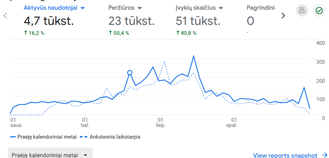
1 pav. 2025 m. statistika apie lankytojų svetainėje www.infoskuodas.lt pokyčius